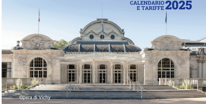
Opera di Vichy